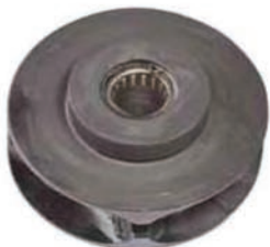
Koło łańcucha nośnego z łożyskiem igłowym