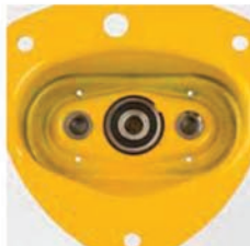
Pokrywa obudowy z łożyskiem kulkowym.

! Wciągniki i wózki Yale nie są przeznaczone do podnoszenia i przenoszenia osób, dlatego nie mogą być używane do tych celów.